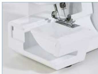
Свободный рукав или плоская поверхность – изменяемая рабочая зона