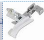
Лапка для пришивания бисера и блесток на ткань.