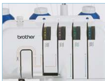
4 цветных направляющих для удобной заправки нити