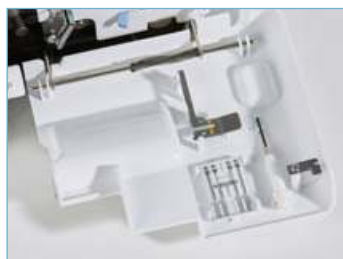
Встроенный отсек для хранения принадлежностей