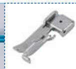
Лапка для канта – для создания канта при соединении двух слоев ткани.