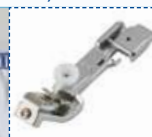
Лапка для пристрачивания тесьмы (резинки) – для пристрачивания тесьмы или резинки на трикотажные ткани.