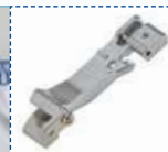
Лапка для присбаривания – для присбаривания и шитья одновременно.

Дополнительную информацию вы можете получить у вашего дилера или посетите www.brothersewing.ru