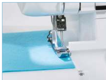
Яркий LED свет