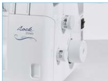
Удобный доступ к управлению