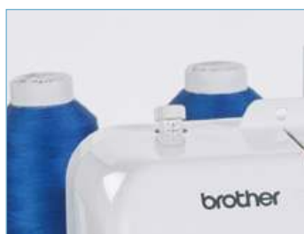
Регулятор прижимной лапки